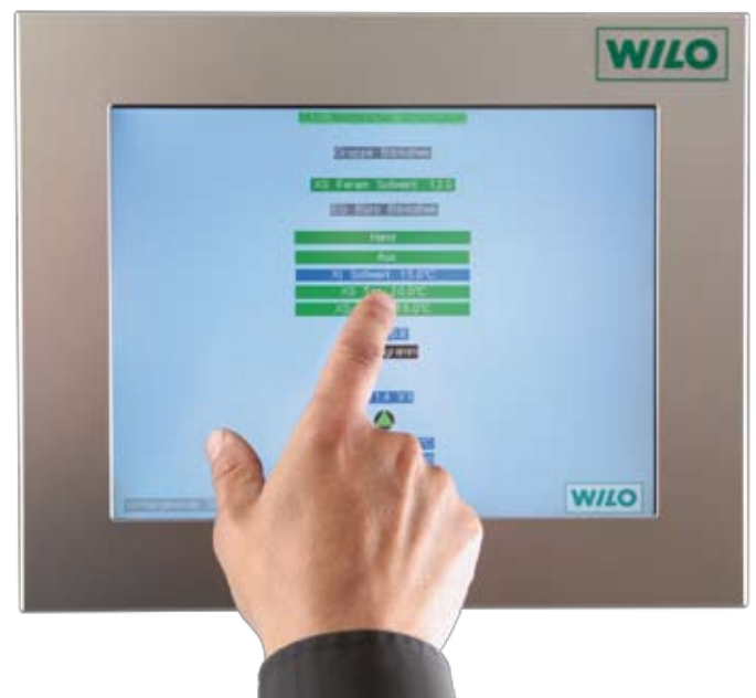
▼ Über eine zentrale Bedienoberfläche in der Heizzentrale können schnell und bequem Temperatur- und Zeitprofile programmiert werden.

Planungsunternehmen zum Zuge. Die aus der Modernisierungsmaßnahme resultierenden Effekte nutzen aber vor allem auch dem Klima sowie dem städtischen Haushalt. Durch den Einsatz des Dezentralen Pumpensystems im Westfälischen Schulmuseum lässt sich der jährliche CO 2 -Ausstoß um rund zehn Tonnen bzw. 29 % reduzieren. Die errechnete Heizenergieerzeugung erspart der Stadt Dortmund erhebliche Betriebskosten und wird nach der rund siebenjährigen Amortisationszeit des Dezentralen Pumpensystems für eine deutliche Entlastung des städtischen Haushalts sorgen.