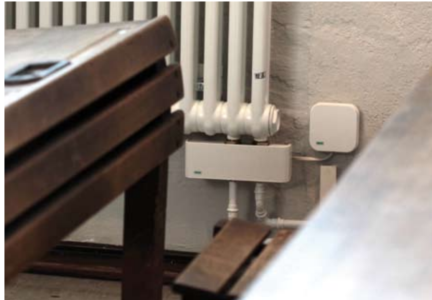
▲ Insgesamt 65 GeniAx-Pumpen übernehmen die Wärmeverteilung im Museum.

Die Fördermittel aus dem Konjunkturpaket II erwiesen sich zweckgemäß als kleines Konjunkturprogramm für die lokale und regionale Wirtschaft. So kam bei der Modernisierung des Schulmuseums mit der IVU Ingenieurbüro GmbH aus Dortmund ein ortsansässiges