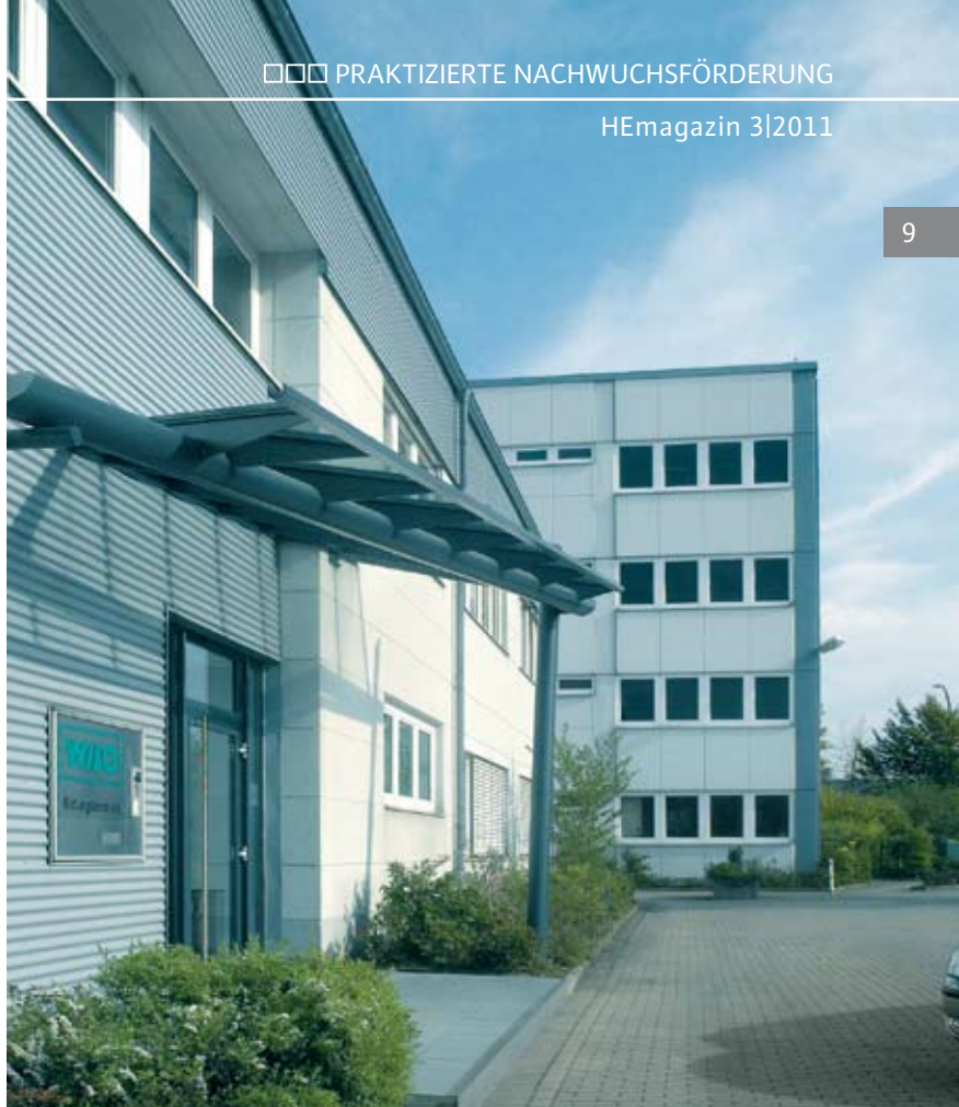
▲ Wilo-Bildungszentrum in Dortmund

2011 wurde Wilo daher auch zum vierten Mal in Folge mit dem begehrten Qualitätssiegel „Top-Arbeitgeber für Ingenieure“ des unabhängigen, international tätigen Instituts Corporate Research Foundation (CRF) ausgezeichnet. Ausschlaggebende Kriterien für die Auszeichnung sind Internationalität, Unternehmenskultur, Vergütung, Work-Life-Balance, Entwicklungsmöglichkeiten, Jobsicherheit und Innovationsmanagement. Im letzteren Punkt erzielte Wilo sogar den zweiten Platz unter allen bewerteten Unternehmen.